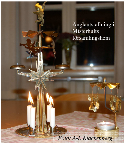
Ängloutställning i Misterhults församlingshem