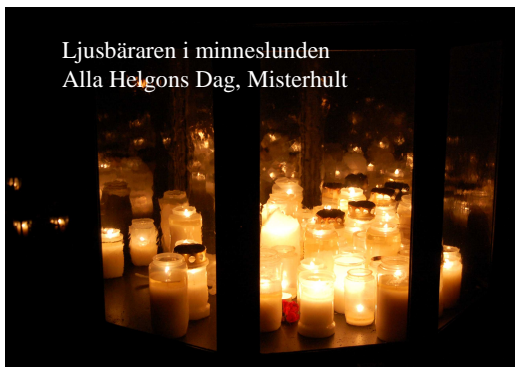
Ljusbäraren i minneslundan Alla Helgons Dag, Misterhult

Intäkterna går till Världens Barn - insamlingen