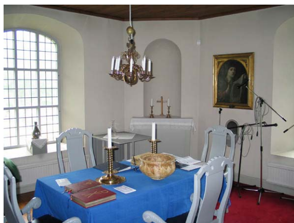
Sakristian mot nordost. (KI Misterhult 0055)