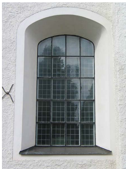
Fönster på långhusfasaden. (KI Misterhult 0084)