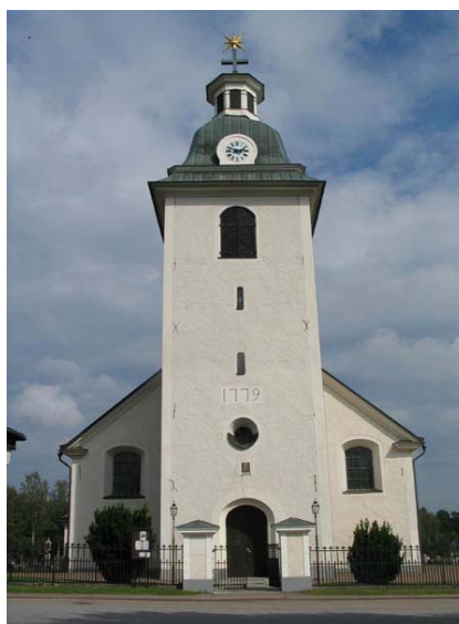
Kyrkan mot öster. (KI Misterhult 0081)