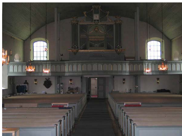
Kyrkorummet mot väster. (KI Misterhult 0033)