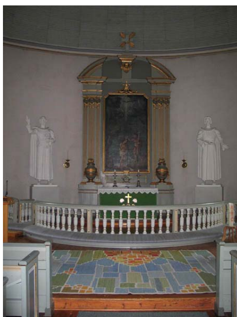
Altaruppsatsen i koret. (KI Misterhult 0029)