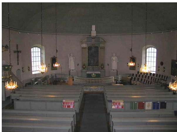
Kyrkorummet mot öster. (KI Misterhult 0001)

altarskåp med S:t Olof. I absiden finns också den öppningsbara skulpturen föreställande Maria med Jesusbarnet samt några ytterligare av kyrkans äldre inventarier.