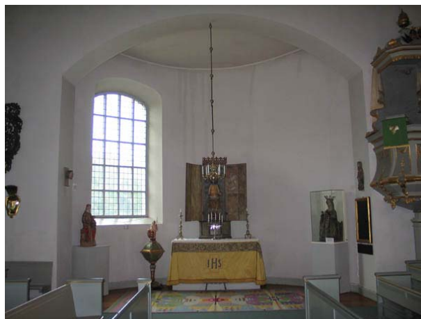
Den norra absiden. (KI Misterhult 0048)