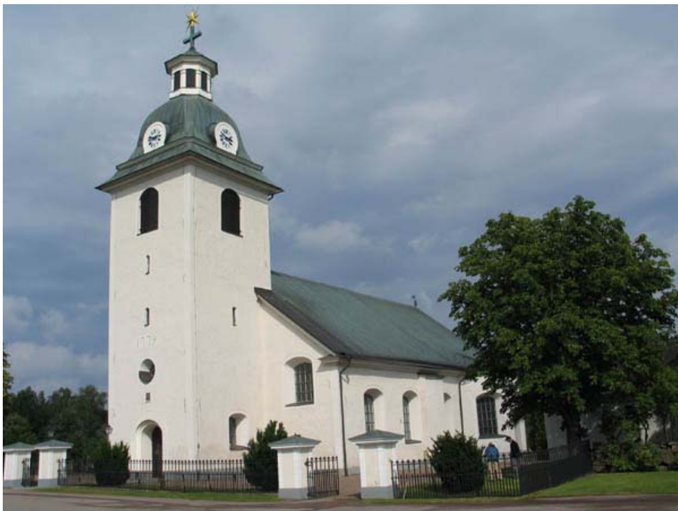
(KI Misterhult 0080)

Linköpings stift Misterhults församling Kalmar län