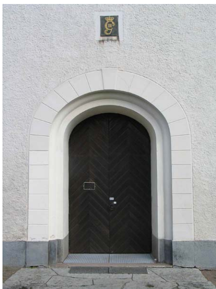
Torningången. (KI Misterhult 0097)