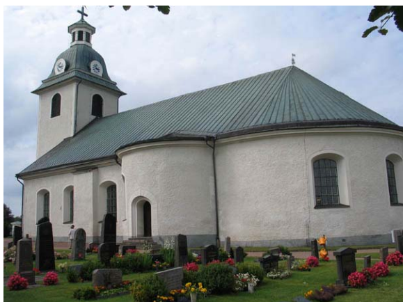
Kyrkan mot nordväst. (KI Misterhult 0088)

I samband med 1974 års renovering konserverades altaruppsats, predikstol samt flera av kyrkans medeltida inventarier. Bland de medeltida inventarierna finns bl a ett altarskåp med S:t Olof, ett triumfkrucifix daterat till 1300-talet och en märklig sk Skrinmadonna, utförd som en öppningsbar skulptur föreställande Maria med Jesusbarnet. Även under 1990-talet och de första åren av 2000-talet har konserveringsarbeten utförts på kyrkans inventarier. På 1990-talet togs också de södra korbänkarna bort och ersattes av en gradäng med stolar. I sakristian finns en separat ingång som inte är ursprunglig. Det är dock oklart när den tagits upp.