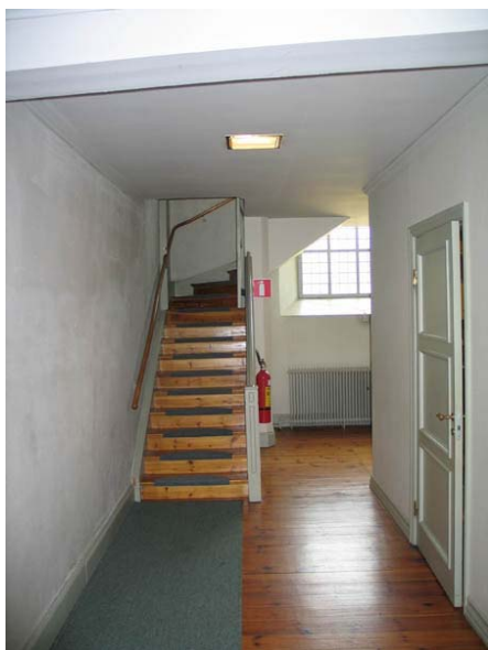
Norra delen av läktarunderbyggnaden. (KI Misterhul 0073)